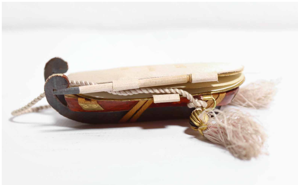
Rechts: Einstimmung auf die Ballsaison: kunstvoll gestaltete Tanzkarte in Schlittenform, Sammlung Südmährisches Museum Thayaland in Laa an der Thaya

„Mein Lieblingsobjekt aus dem Museum ist eine kleine Tanzkarte in Schlittenform, da sie [...] mich an Historienserien wie aktuell ‚Bridgerton‘ erinnert.“