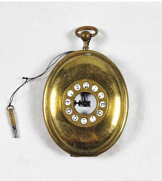
Links: Praktisch und vielsagend: Reiseuhr von Kronprinz Rudolf, Sammlung Heimatmuseum Persenbeug-Gottdorf