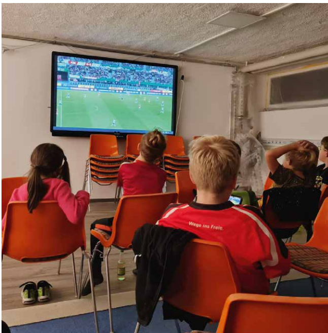
Der Veranstaltungsraum wurde auch schon von den ganz Jungen genützt.

Da sowohl das Gebäude als auch die Einrichtung durch die Gemeinde erhalten wurden, ging es als Nächstes um die Finanzierung der Neugestaltung. Die öffentliche Hand bietet hier sehr viele Möglichkeiten. Es begann die Zusammenarbeit mit der LEADER-Region Wachau-Dunkelsteiner-